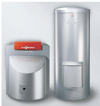
Moderne Heizkessel benötigen wesentlich weniger Energie als uralte Anlagen (Bild: Viessmann).