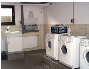
Leider keine Seltenheit. Eine voll aufgedrehte Heizung und gleichzeitig gekippte Fenster in Waschküchen und Trockenräumen. Keiner kümmert sich darum. Schlimmer kann man Wärmeenergie nicht vergeuden.

Trockenräume, Waschküchen und Treppenhäuser sind besondere Schwachpunkte. Hier wird in Mehrfamilienhäusern oft unkontrolliert geheizt, weil viele meinen, dass es sie selbst nichts kostet. Dabei gehen die Kosten dieser Allgemeinräume in die Heizkostenabrechnung von jedem Einzelnen ein. Alle sollten deshalb ein Interesse an sinnvoller Beheizung haben. Im Winter sollten auch alle Hausbewohner darauf achten, dass Fenster im Treppenhaus, im Trockenraum oder im Dachboden nicht unnötig geöffnet bleiben. Vor allem in Waschküchen, Trockenräumen und im Keller wird häufig viel zu viel gelüftet. Das erhöht die Heizkosten der Mieter in den Erdgeschosswohnungen zum Teil erheblich.