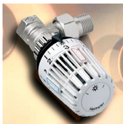
Thermostatventile helfen beim Sparen, wenn man sie richtig verwendet.

Thermostatventile sollen eine eingestellte Raumtemperatur halten. Das Ventil öffnet, wenn die Einstellung unterschritten wird, das Ventil schließt, wenn die Temperatur erreicht ist. Wird der Heizkörper zugebaut oder zugehängt, kann das Thermostatventil nicht mehr die Raumtemperatur erfassen, sondern nur noch die erhöhte, gestaute Wärme. Um zur gewünschten Raumtemperatur zu kommen, muss die Einstellung höher gewählt werden, als eigentlich erforderlich wäre. Die Funktion des Thermostatventils ist gestört. Der gewünschte Einsparungseffekt ist nicht mehr möglich. Lässt sich eine Verbauung nicht verhindern, so sollten Sie den Heizkörper nach Möglichkeit gar nicht anstellen oder Thermostatventile mit Fernfühlern verwenden.