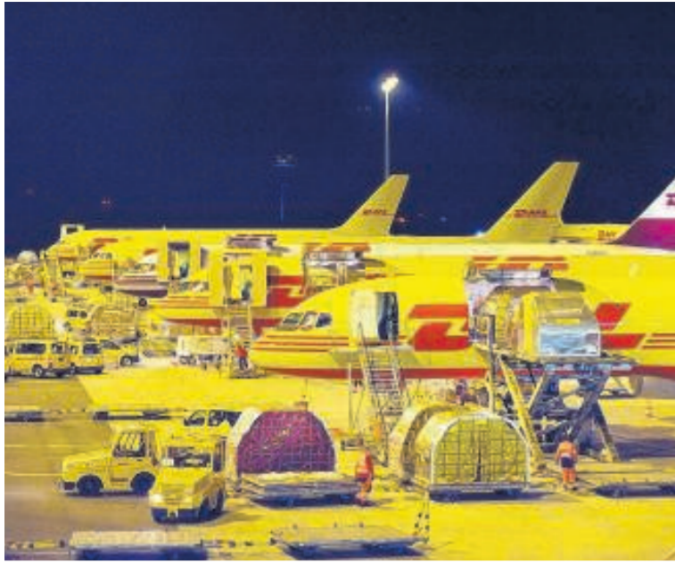
DHL beschäftigt am Flughafen 3000 Mitarbeiter.