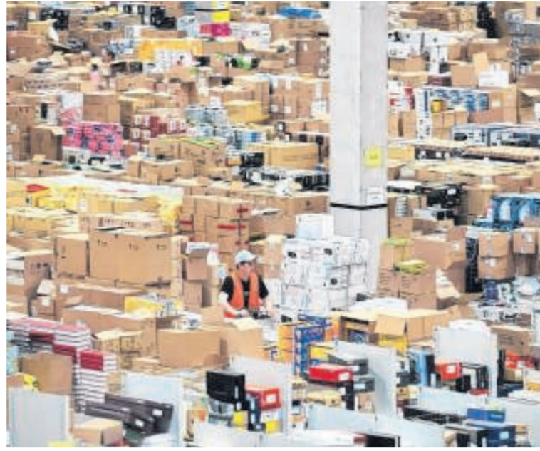
1000 zählt die Stammelegschaft bei Amazon.