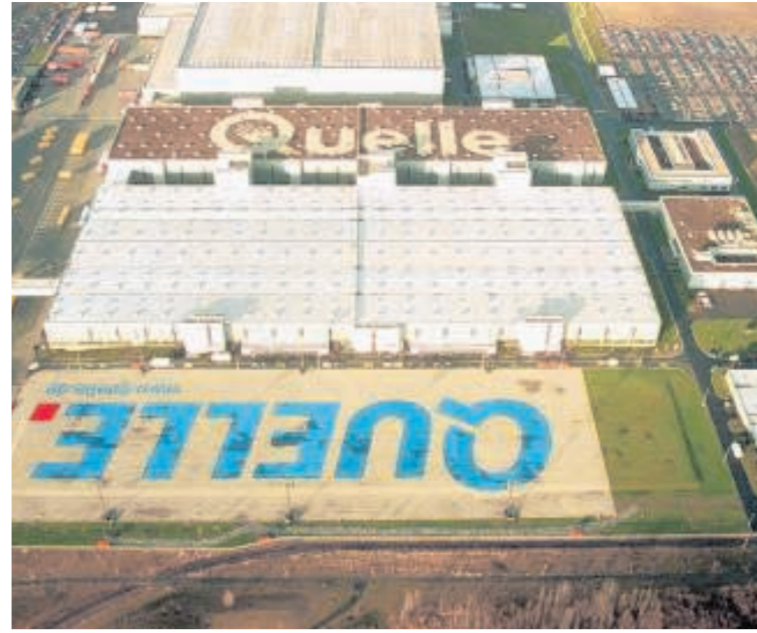
Auf dem früheren Quelle-Areal dürften 2012 hunderte Jobs entstehen.