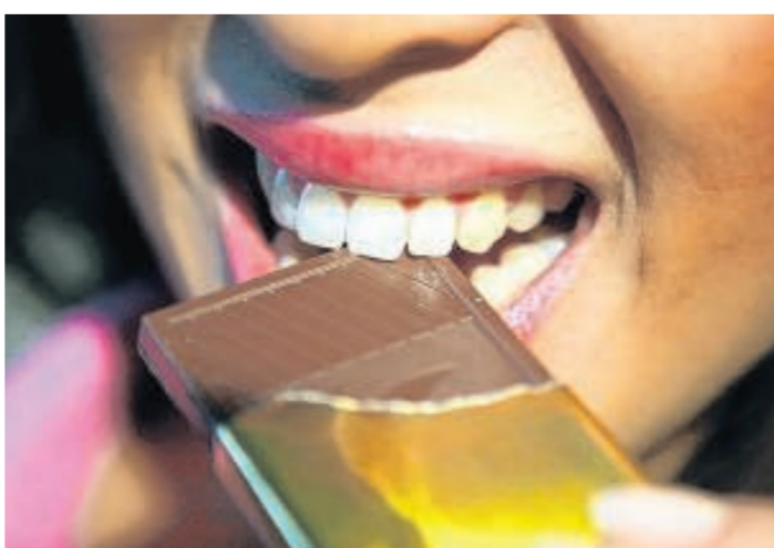
Schokolade ist auch was fürs Herz.

Für die gestern vorgestellte Studie werteten die Wissenschaftler die Daten von sieben Untersuchungen mit