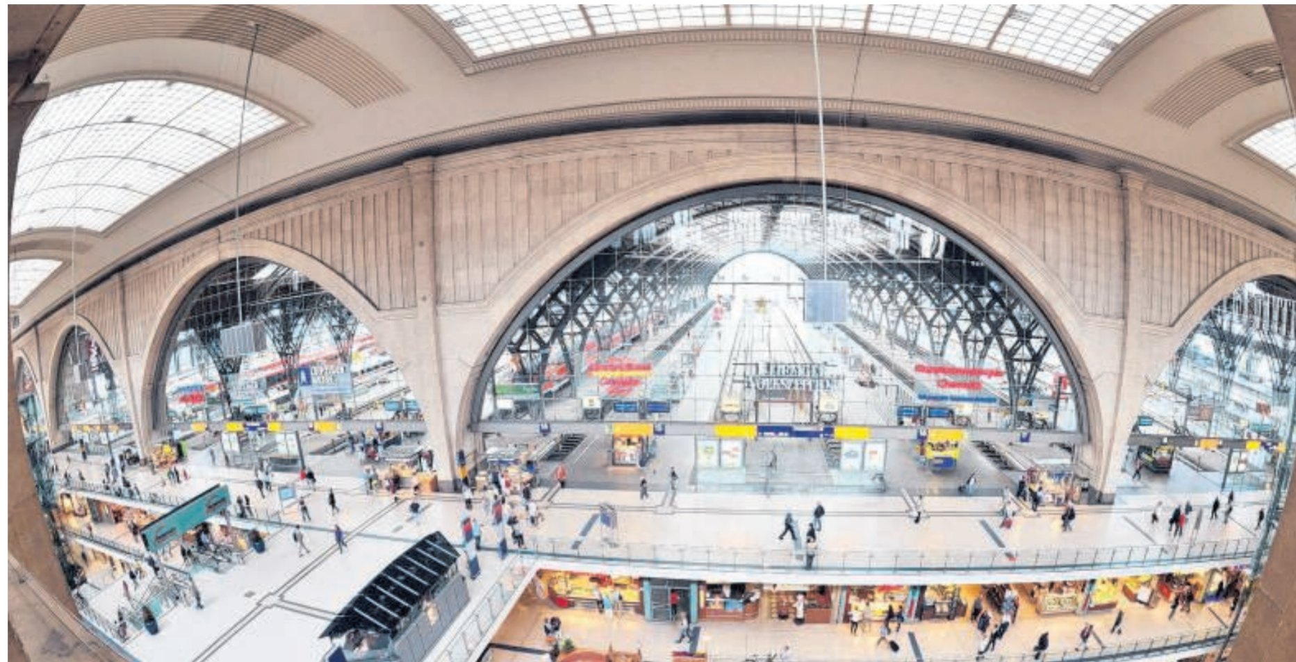
Bahnhof des Jahres: Leipzigs Hauptbahnhof kann die Jury mit Kriterien wie Kundeninformation, Sauberkeit, Einbindung in die Stadt und Verknüpfung mit anderen Verkehrsmitteln überzeugen. Er erfülle den schon bei seiner Eröffnung 1915 formulierten Anspruch einer „Kathedrale des Fortschritts“.