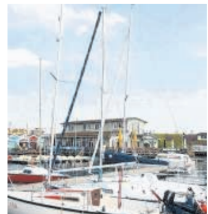
Attraktiv: die Freizeitangebote am Cospudener See.