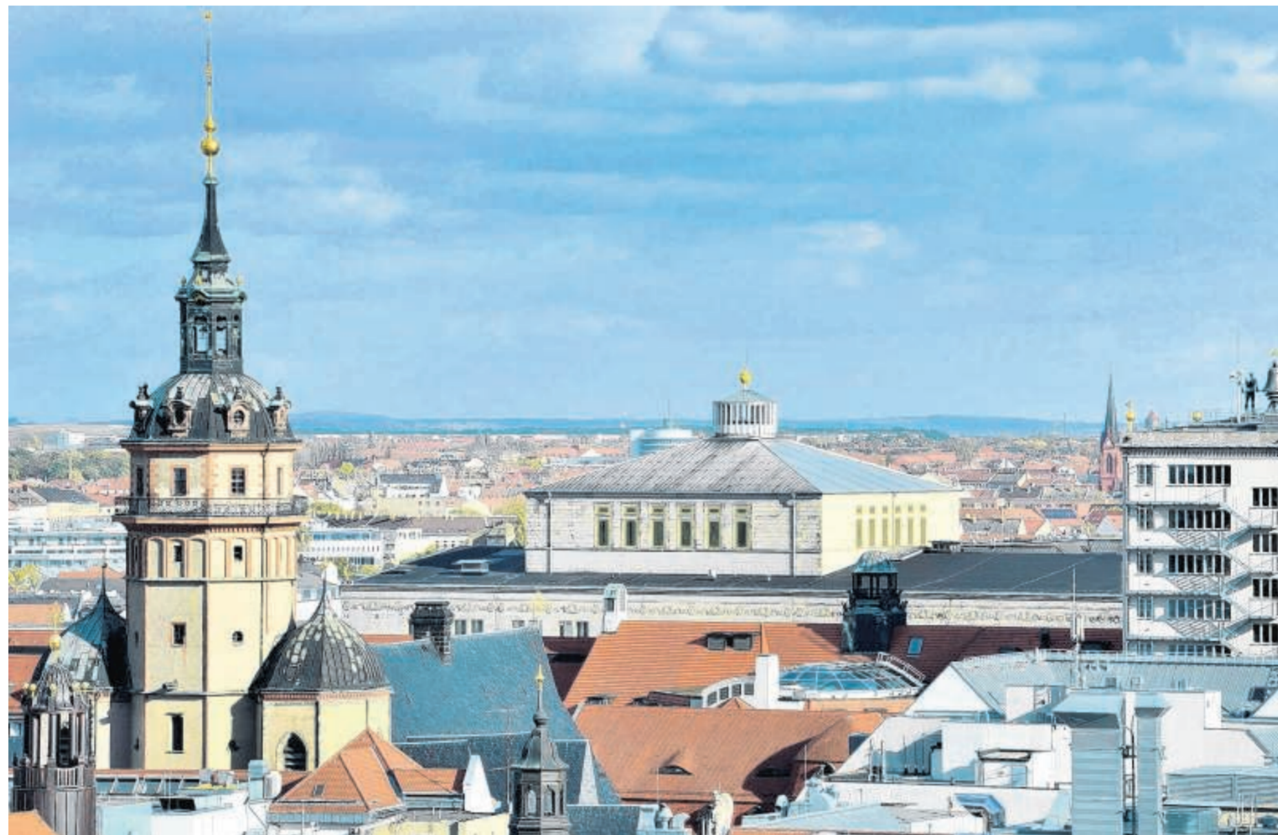
Musikstadt, Messestadt, Stadt der Wissenschaft – Leipzig hat viele Attribute und Anziehungspunkte, wie auch jener Teil der markanten Skyline mit Nikolaikirche, Opernhaus und Krochhaus auf unserem Foto zeigt.

Alle Dresdner Argumente finden Sie unter www.lvz-online.de .