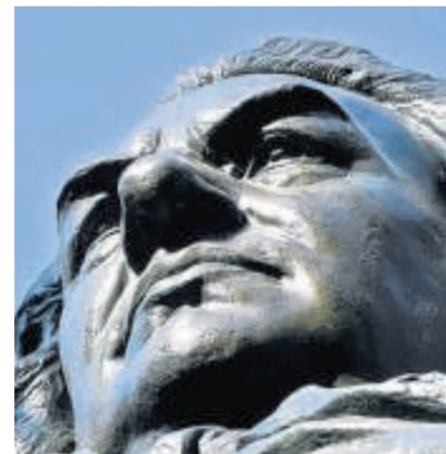
Weltberühmt: Thomaskantor Johann Sebastian Bach.