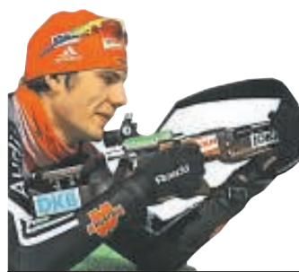
Biathlon Arnd Peiffer erobert in Oberhof Rang zwei Seite 28