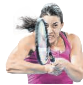
Tennis Andrea Petkovic im Finale von Brisbane Seite 28