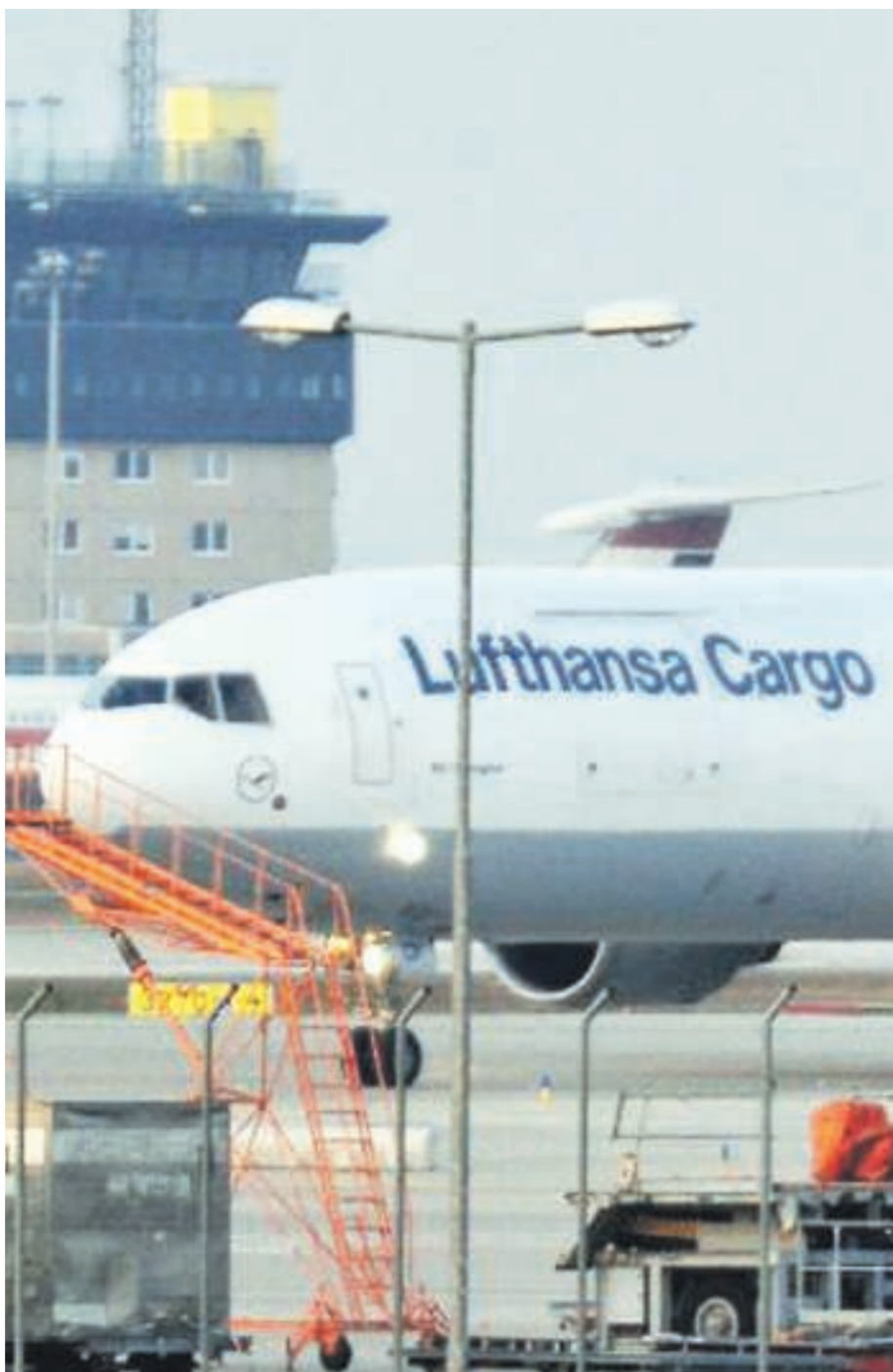
Schon jetzt kommen etwa 200.000 Besucher zum Flughafen Leipzig/Halle. Künftig sollen es noch mehr werden. Der Flughafen plant einen Eventpark.

Der Flughafen Leipzig/Halle möchte einen Erlebnispark bauen, um den Standort attraktiver zu machen