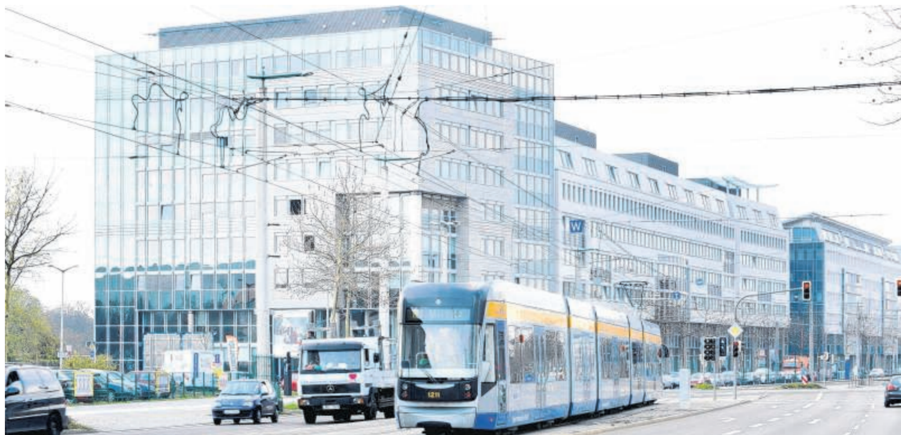
Das Technische Rathaus in Leipzigs Prager Straße.

Schott Solar, Solaranlagenbauer, will wegen des anhaltenden Preisdrucks in der Branche eine Produktion in Asien aufbauen. Über Investitionssummen wurde nichts bekannt.